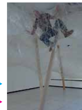
▶ The first Tape installation in the HDD Gallery, 2009

threesome, presented themselves in the design gallery through something that is not design according to any conventional definition. Numen explained their decision by saying they simply did not like the idea of a gallery exhibition of an object that was already in use. At the same time, we may say that Tape was a way for a group of authors previously doing industrial design (mostly for foreign investors) and theatre scene design, to explore spaces between the scenic and design domains, as well as between their self-initiated and commissioned works. They were criticised for stepping back, towards 'art', which is especially interesting because Numen began their work at the end of the nineties by openly holding a rigid position that design should be exclusively functional and utilitarian. Thus the name 'For Use', used even today. As much as this criticism was legitimate then, the later versions of Tape gradually showed more complexity than shallow playing with artistic procedures. When the installation became habitable, that is, with the idea that the visitors could freely move around inside it, Numen had to use their designer experience to resolve that problem. For each location and context from scratch. ▶ The semi-transparent tunnels are made of miles and miles of sello-tape, a material that does not inspire trust in security and loses elasticity with time, so the installation has a limited duration.