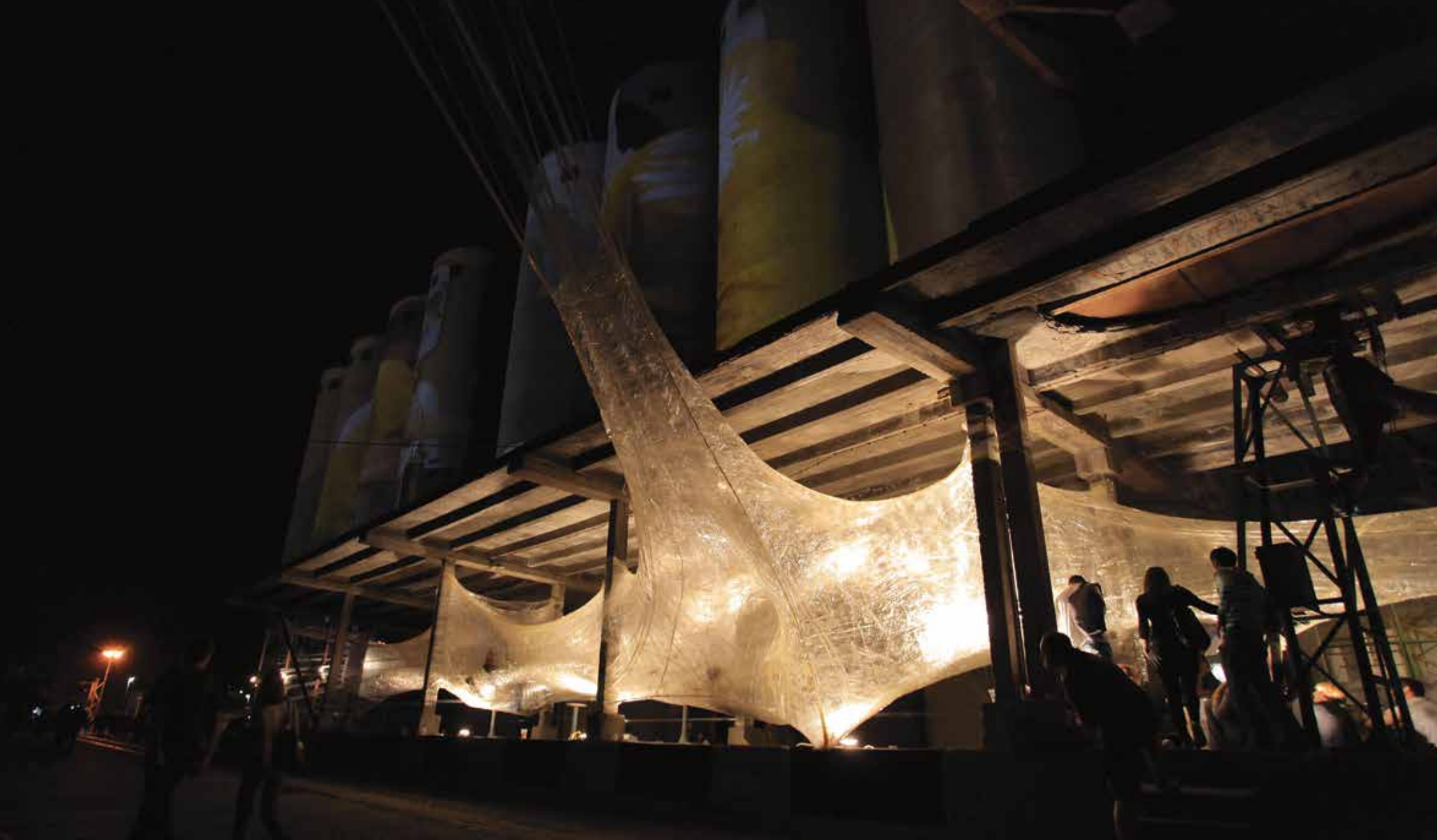
▲ Tape Belgrade, Mikser Design Expo, Beograd, 2010.