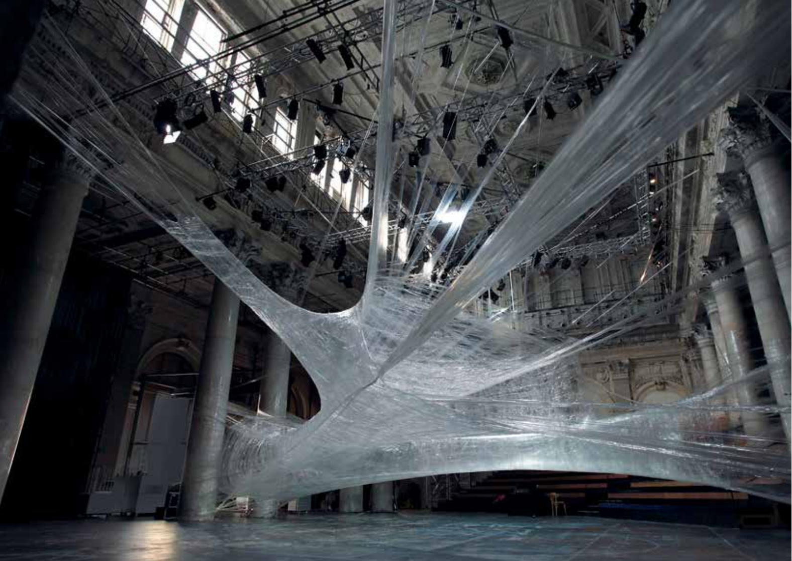
▲ Tape Vienna, Odeon, Beč, 2010.