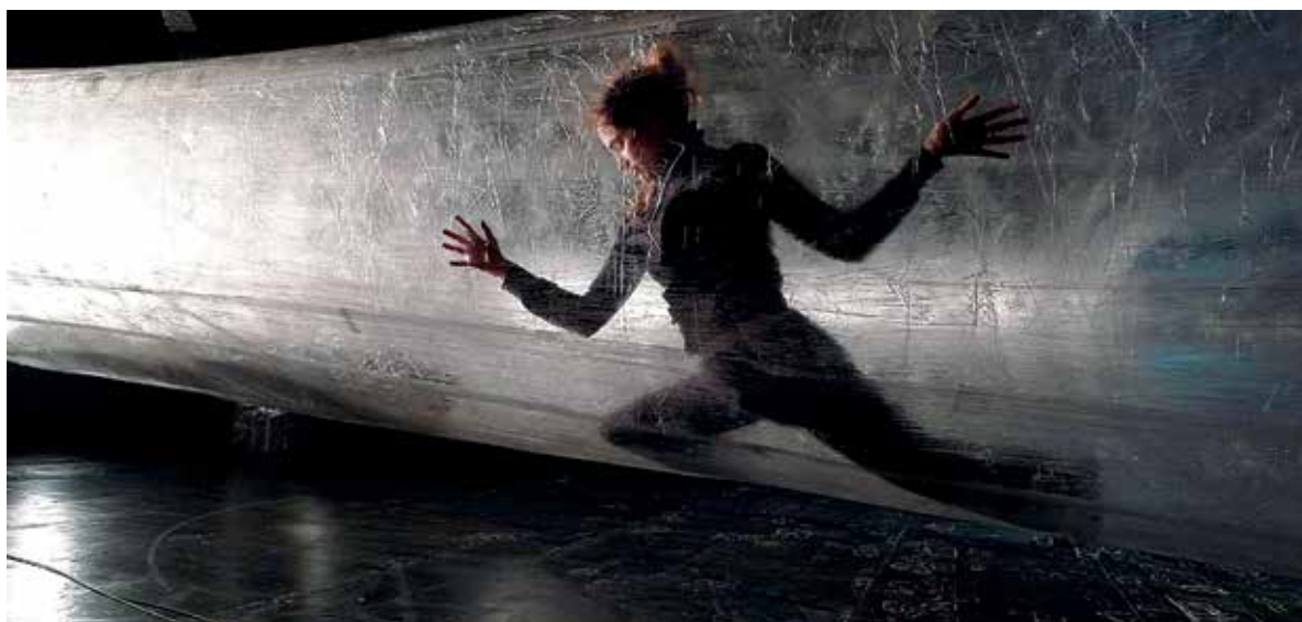
▶ Tape Vienna, Odeon, Beč, 2010.