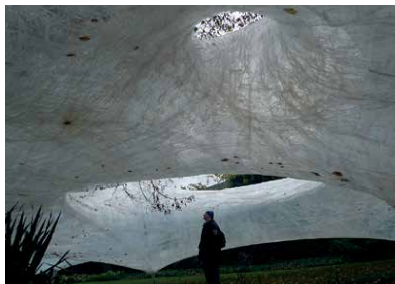
▲ Tape Hasselt, House for Contemporary Art Z33, Hasselt, Belgija, 2012.